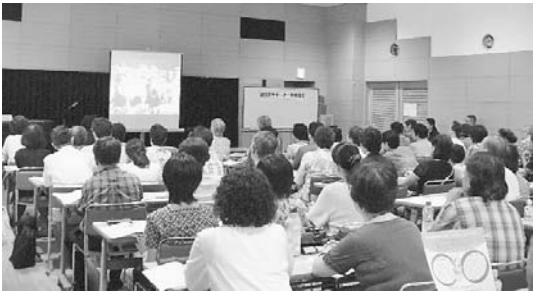
皆さん真剣に講義を聞いています