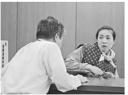
寸劇で講義のおさらいをします