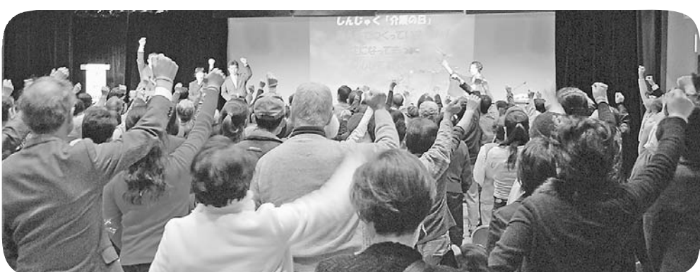
講座の締めくくりには、認知症になっても安心して暮らせるまちづくりを目指し、みんなで作っていきこう!!