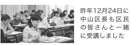
昨年12月24日に中山区長も区民の皆さんと一緒に受講しました