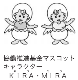
協働推進基金マスコットキャラクター KIRA・MIRA

◆ふれあい・いきいきサロン 【まごころこめ倶楽部】 区内在住の高齢者・障害者の方を対象にした、住民同士が交流できるサロンです。 ①絵手紙作りとおしゃべりの会 【日時】2月12日(休)午後2時～4時(1時30分開場) 【会場】東京山の手まごころサービス(高田馬場1-32-7) ②初めてのそば打ち・手作りめんを味わおう会 【日時】3月6日(休)午後2時～4時(1時30分開場) 【会場】大久保地域センター(大久保2-12-17) ……以下共通)…… 【定員】①は15名・②は20名 【費用】各回300円 【問合せ】NPO法人東京山の手まごころサービス ☎(3205) 6813へ。