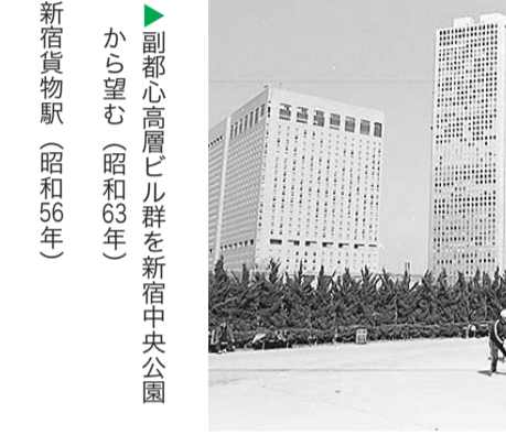
副都心高層ビル群を新宿中央公園から望む(昭和63年) 新宿貨物駅(昭和56年)